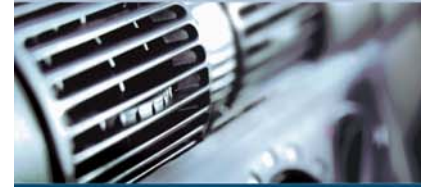
Klima Bakım Cihazları