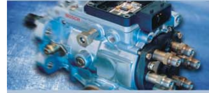
Dizel Yakıt Sistemleri Testi