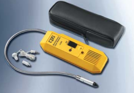
Elektronik sızıntı detektörü