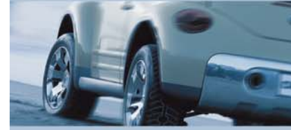
Fren Sistemi ve Işıklıdırma Sistemi Testi