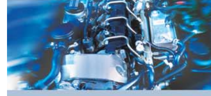
Araç Sistem Analizi