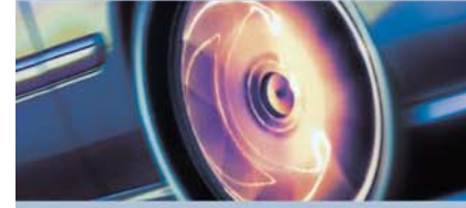
Ön Düzen Testi