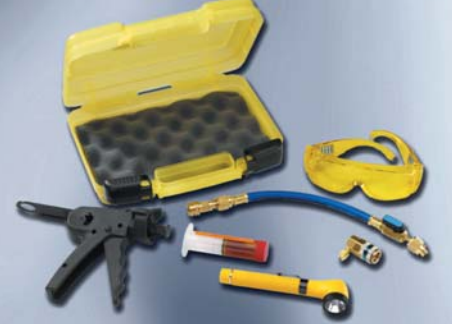
Özel çantalı UV sızıntı tespit kiti