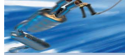
Egzoz Emisyonları Testi