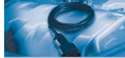
Kontrol Ünitesi Arıza Tespiti

Teknik konularda ve ürün programında değişiklik yapma hakkı saklıdır.